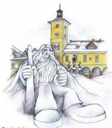
Omalovánky The colouring pictures

Jilemnické omalovánky jsou zaměřeny na typické objekty a tradice ve městě. Upoutají krásnými ilustracemi a doprovodným textem, který je psaný českým a anglickým jazykem.